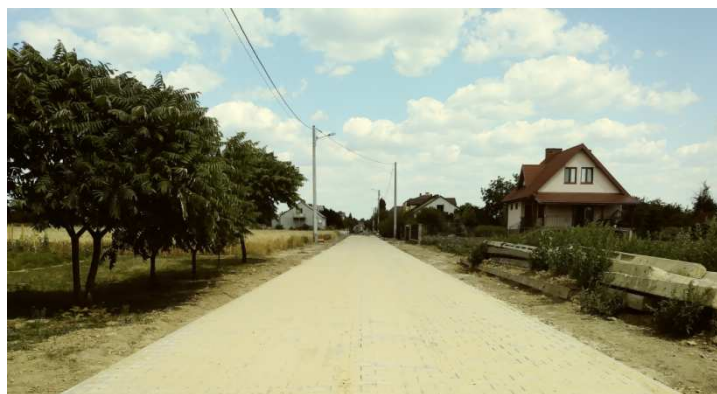
Przebudowa drogi gminnej w m. Zajezerze – ul. Wiśniowa