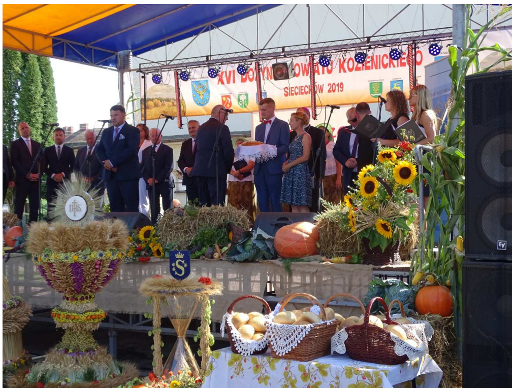
XVI dożynki powiatu kozienickiego Sieciechów 2019 (sierpień 2019)