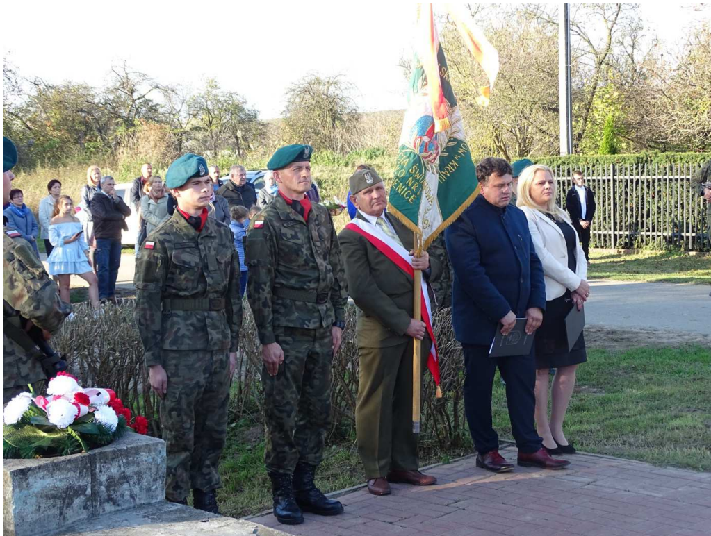
Rocznica pacyfikacji wsi Kępice (październik 2019)