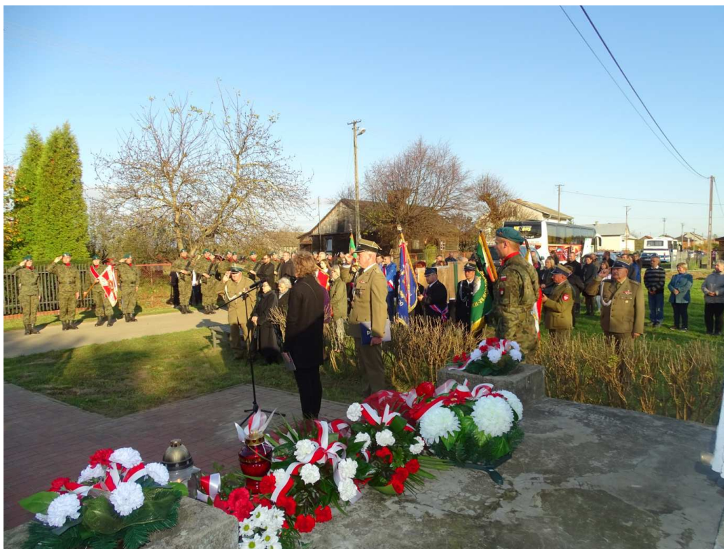
Rocznica pacyfikacji wsi Kępice (październik 2019)