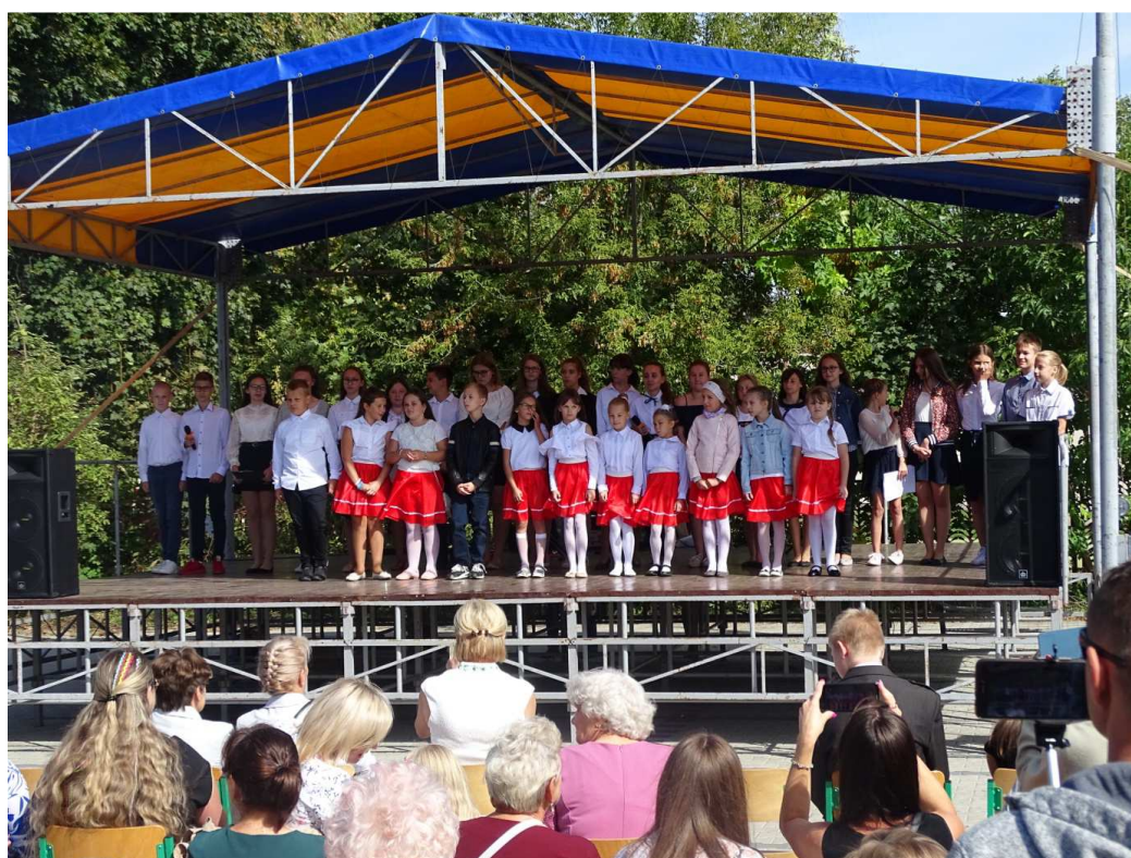
Święto 28 Pułku Artylerii Lekkiej w Zajezerzu (wrzesień 2019)