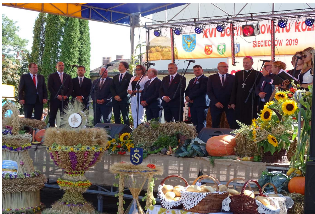
XVI dożynki powiatu kozienickiego Sieciechów 2019 (sierpień 2019)