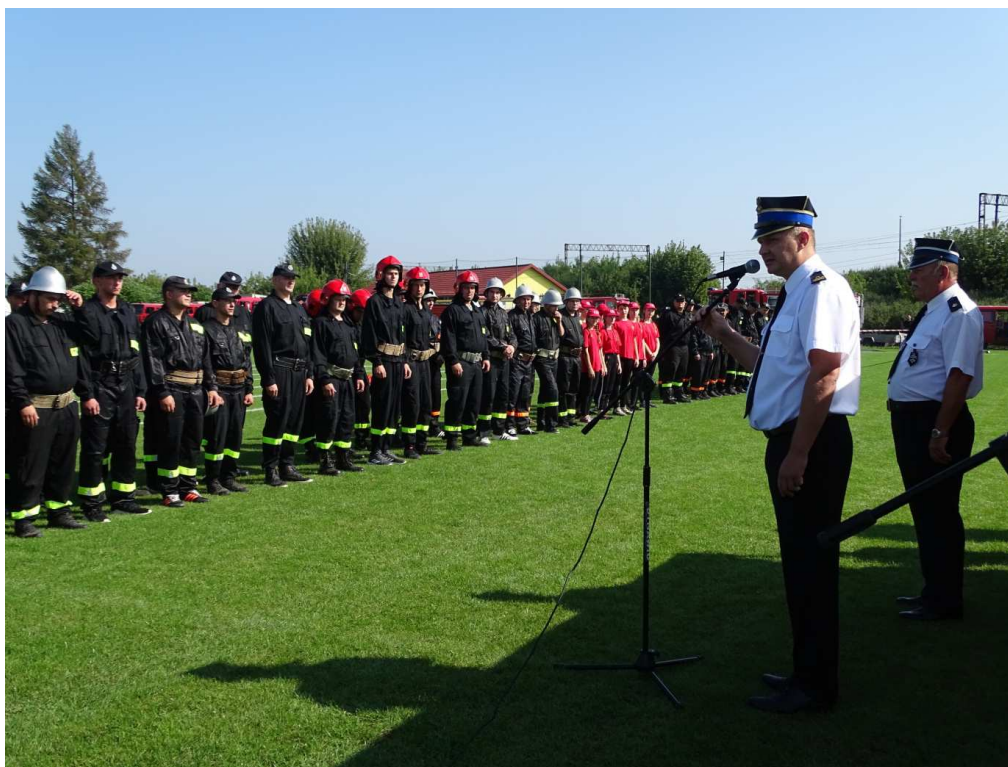
Międzygminne zawody sportowo-pożarnicze (wrzesień 2019)