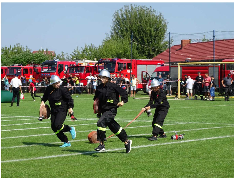
Międzygminne zawody sportowo-pożarnicze (wrzesień 2019)