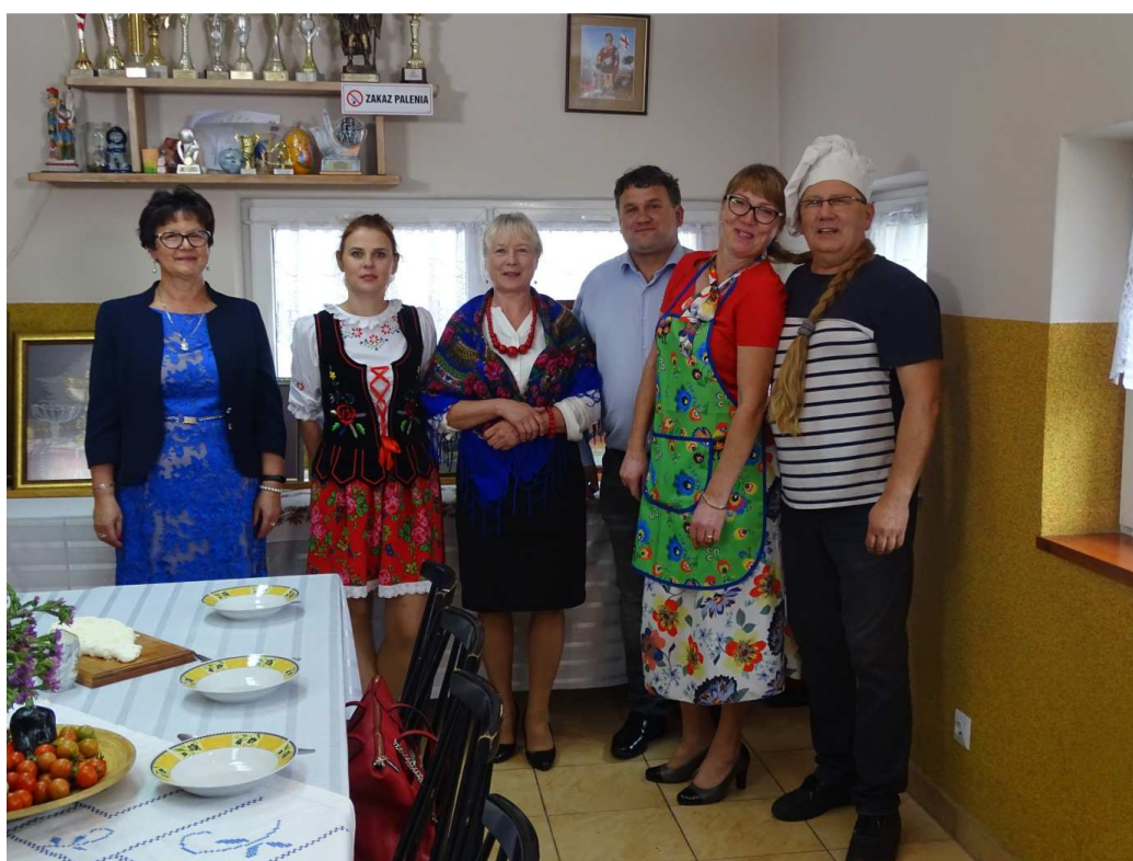
Nagranie programu „Smaki ziemi Kozienickiej” promującego Gminę Sieciechów (październik 2019)