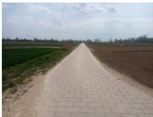
Przebudowa drogi gminnej w m. Mozolice Małe – etap II

Zadanie zostało dofinansowane ze środków finansowych budżetu Województwa mazowieckiego w wysokości 45 000,00 zł.