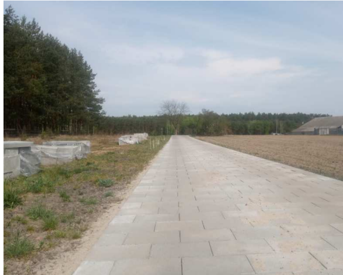
Remont drogi gminnej Słowiki Stare - Leśna Rzeka