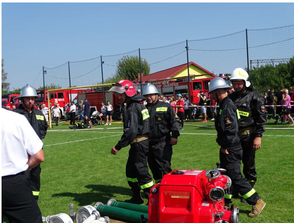
Międzygminne zawody sportowo-pożarnicze (wrzesień 2019)