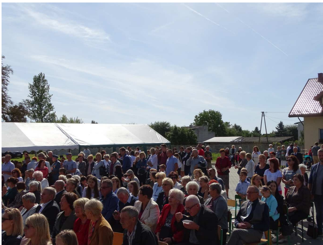
Święto 28 Pułku Artylerii Lekkiej w Zajezerzu (wrzesień 2019)