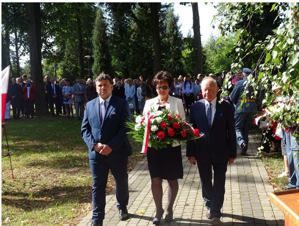
Święto 28 Pułku Artylerii Lekkiej w Zajezerzu (wrzesień 2019)