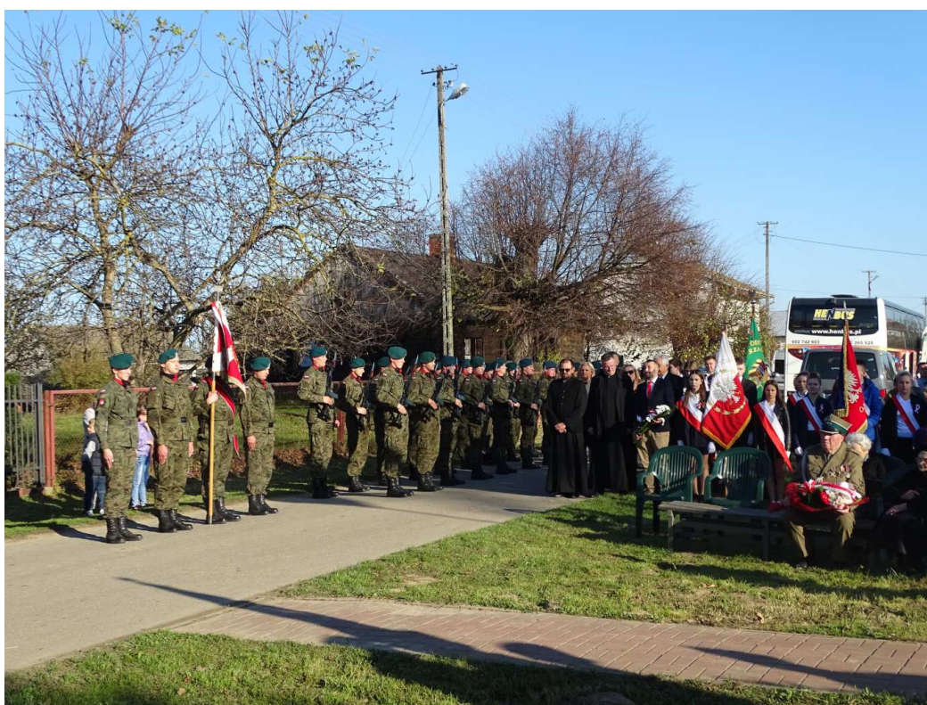
Rocznica pacyfikacji wsi Kępace (październik 2019)