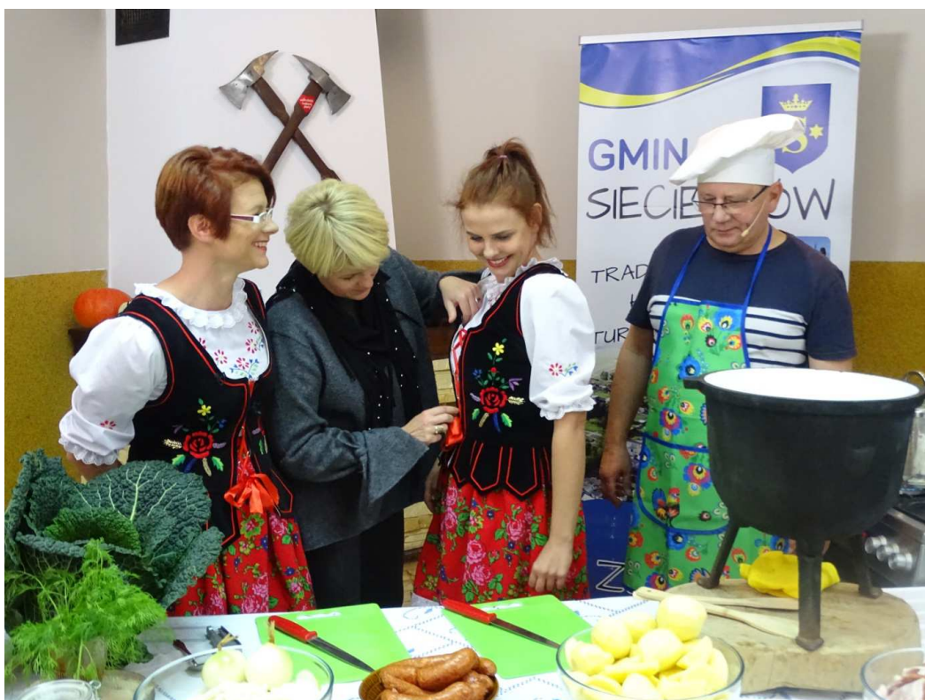
Nagranie programu „Smaki ziemi Kozienickiej” promującego Gminę Sieciechów (październik 2019)